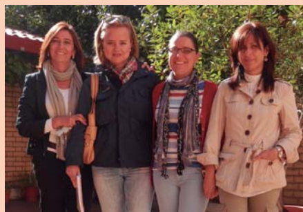
13/10/2013. La jefa de la Zona de Acción Social Pisuegra del Ayuntamiento de Valladolid